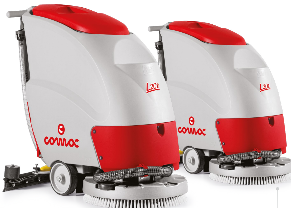
L20 B Versione batteria con spazzola a disco